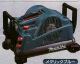
メタリックブルー