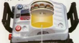
従来モータサイズ