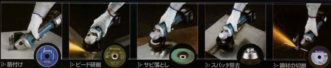
※筋付け ※ビード研削 ※サビ落とし ※スパッタ除去 ※鋼材の切断