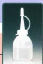
モータ部・ハンマ部兼用オイル