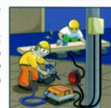
電圧の変化に応じて回転数を覚えて、圧縮運転。

兼松DCブラシレスコンプレッサのモータはカネマツが独自に開発したDC(直流式)ブラシレスモータ。低電圧下では、電圧に合わせてモータの回転数を電子制御するので、常に電圧環境下における100%の仕事(圧縮運転)を可能にし、50Vでも圧縮運転します。