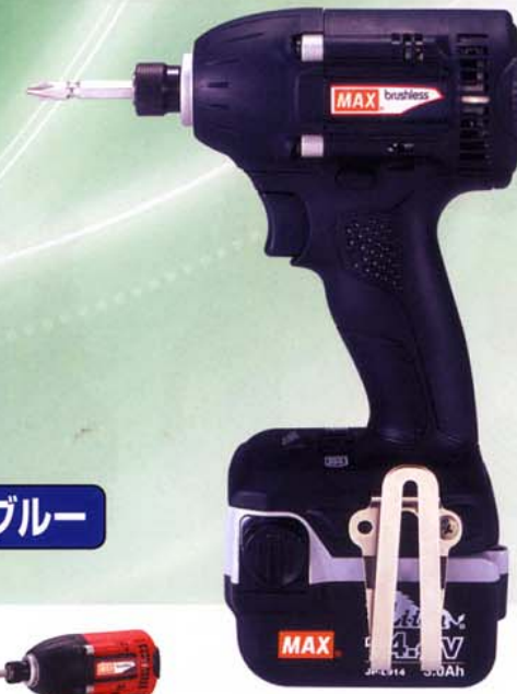
シャープブラック

クラス最短 139mm!! ※14.4V充電インパクトドライバでの比較、2008年4月当社調べ。 どんな箇所でも取り回し抜群。ビットとビスの長さを含めても余裕があるから、サッシなどを傷めません。