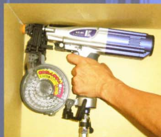
現場でのきわ打ち例