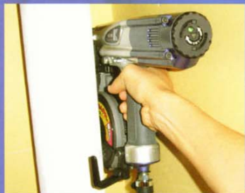
現場での狭小な場所打ち例