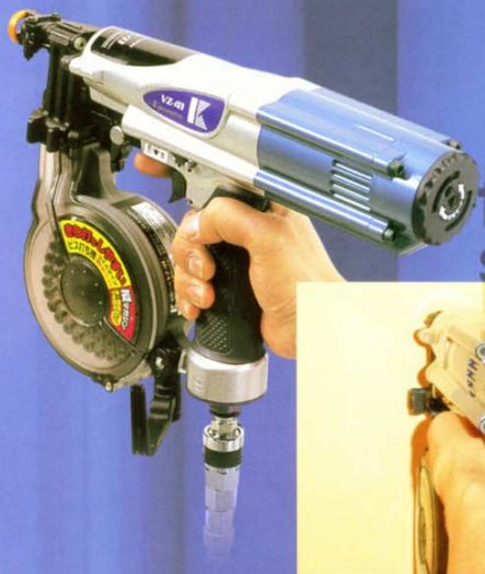
現場での壁のきわ打ち例